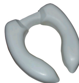
Kat. číslo ZRERHI01210100 Nástavec na WC APOLLO