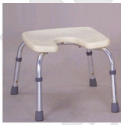
Kat. číslo ZREPRM901067A0 Sedačka do sprchy Alu nastavitelná výška, hygienický výřez