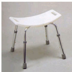
Kat. číslo ZREPRM90106700 Sedačka do sprchy Alu