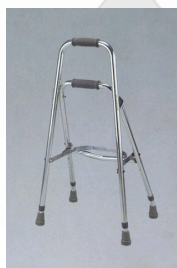
Kat. číslo ZREPRM90103900 Kozíčka duralová opěrná