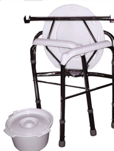
Kat. číslo ZREPRM90106500 Klozetové křeslo pevné - skládací 90 - 1065