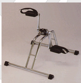
Kat. číslo ZREPRM90301100 Šlapadlo rehabilitační pedálové