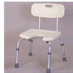
Kat. číslo ZREPRM901068A0 Sedačka do sprchy Alu s opěradlem, nastavitelná výška, hygienický výřez