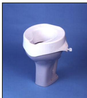
Kat. číslo ZREGEL70000100 Nástavec na WC Cosby