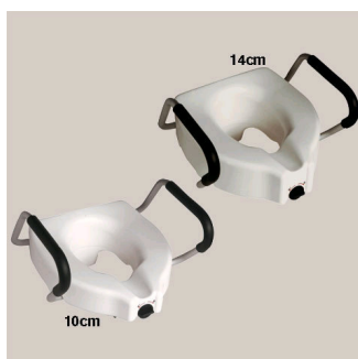
Kat. číslo ZRERHI01110100 Nástavec na WC EASYSAFE