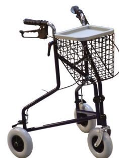
Kat. číslo ZREPRM90106100 Chodítko Delta 90-1061 trojkolové