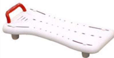
Kat. číslo ZRERHI016101 Sedačka na vanu PROFILO s madlem