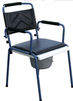
Kat. číslo HVRTZS201 Vozík toaletní TZ 201