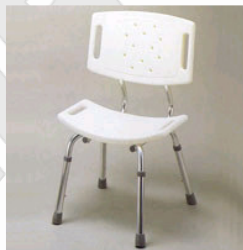
Kat. číslo ZREPRM90106800 Sedačka do sprchy Alu s opěradlem