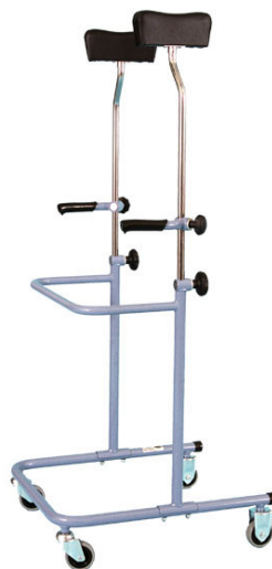
Kat. číslo 2725.0006 Chodítka U-2