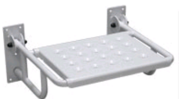
Kat. číslo HVRKSSSKA Sedačka sprchová sklopná typ A bez výřezu