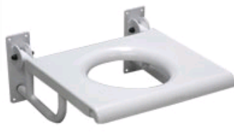
Kat. číslo HVRKSSSKL Sedačka sprchová sklopná typ B s výřezem