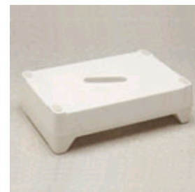
Kat. číslo ZREGEL70206000 Stupínek zvyšovací Ashby