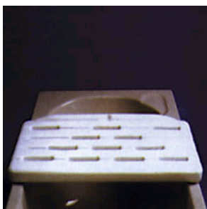
Kat. číslo ZREGEL70102100 Sedačka na vanu Derby