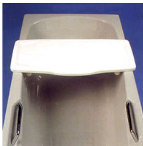
Kat. číslo ZREGEL70002000 Sedačka na vanu Cosby