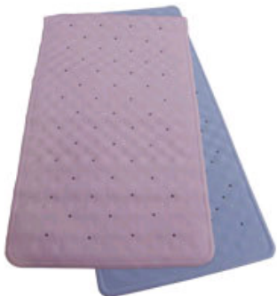
Kat. číslo ZREPRM902035 a ZREPRM90203400 Podložka protiskluzová do vany nebo do sprchového koutu