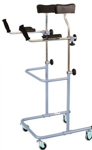
Kat. číslo 2725.0003 Chodítka U-2A