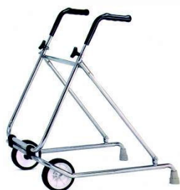
Kat. číslo ZREPRM90610300 Chodítko dvoukolové