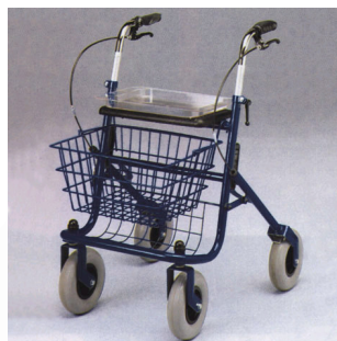
Kat. číslo ZREPRM90610400 Chodítko čtyřkolové 90-6104