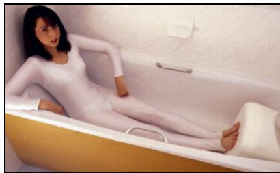
Kat. číslo ZREGEL70205100 Pomůcka do vany - zkracovač Ashby