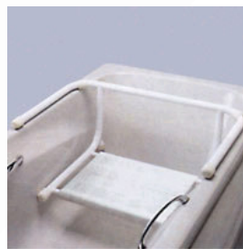
Kat. číslo HVRKVSZAV Sedačka vanová závěsná