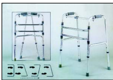
Kat. číslo ZREPRM901060G Chodítko čtyřbodové 90.1060 G Kat. číslo ZREPRM901060RG Chodítko čtyřbodové 90.1060 RG