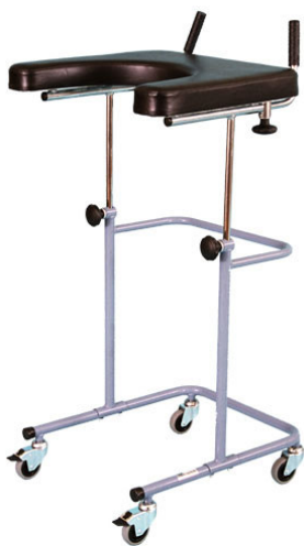
Kat. číslo 2725.0001 Chodítka U-2B