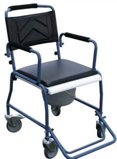
Kat. číslo HVRTVS201 Vozík toaletní TV 201