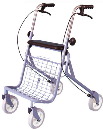
Kat. číslo 2725.0005 Chodítka U-1