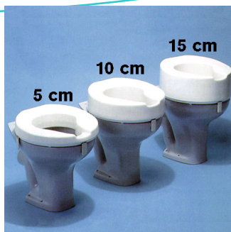
Kat. číslo ZREGEL70201100 až 300 Nástavec na wc Ashby Super