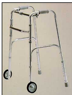
Kat. číslo ZREPRM901060GW Chodítko čtyřbodové 90.1060 GW